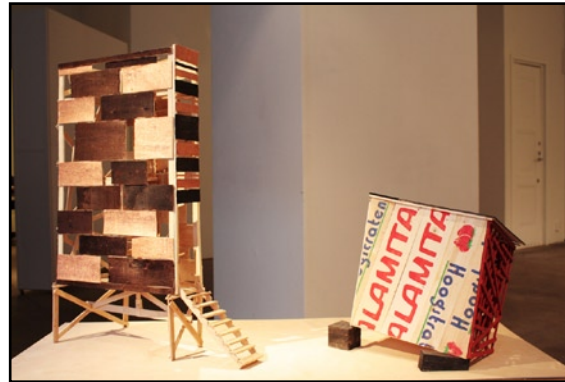
Homeless Experience, 2008 puu, muste pigmentti 25 x 25 x 25 ja 50 x 15 x 25cm