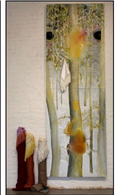
Haapojen luona, 2009 360 x 122 cm akryyli levyllä, tekstiili