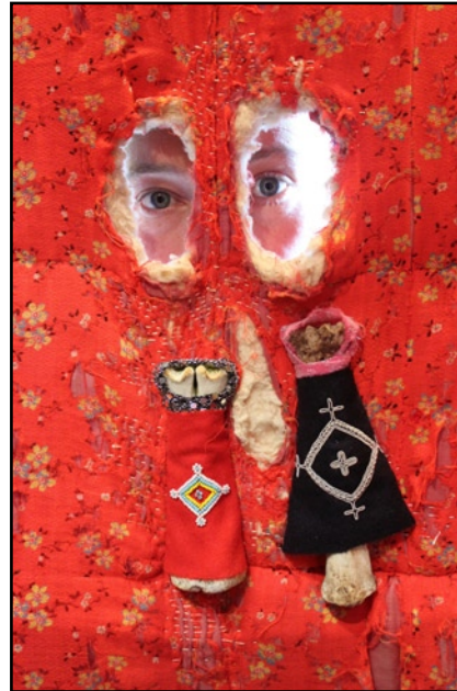
Piilopaikka, 2008 yksityiskohta/ detail 180 x 135 x 135cm sekatekniikka